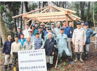
◆清水洞の上自然を守る会の皆さん